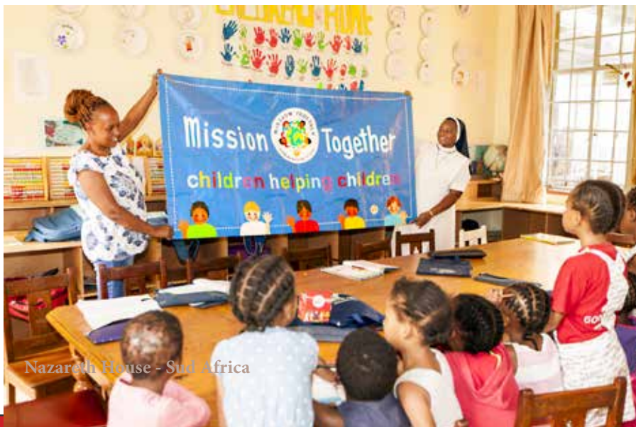
Nazareth House - Sud Africa

Per il mese di maggio, il mese di Maria, abbiamo aggiornato ed adattato il nostro materiale mariano per incoraggiare i bambini a chiedere l'intercessione di Nostra Signora. Come i santi bambini Giacinta e Francesco pregavano durante i giorni bui della Prima Guerra Mondiale, così anche i bambini possono portare speranza al mondo pregando