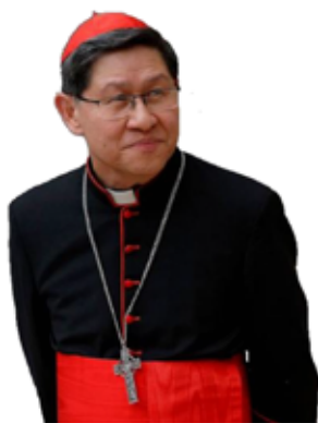
Cardinale LUIS ANTONIO G. TAGLE , Prefetto della Congregazione per l'Evangelizzazione dei Popoli

I contributi possono essere versati anche al conto: VA31001000000040286004 (SWIFT/BIC: IOPRVAVX) (€) VA04001000000040286005 (SWIFT/BIC: IOPRVAVX) (USD $) intestato all'Amministrazione delle Pontificie Opere Missionarie, indicando: Fondo Corona-Virus