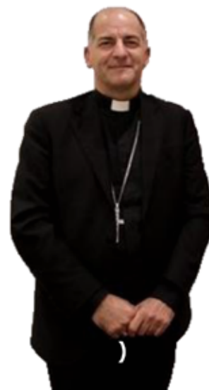
Arcivescovo GIAMPIETRO DAL TOSO , Presidente delle Pontificie Opere Missionarie

«Questo Fondo ha lo scopo di sostenere la presenza della Chiesa nei territori di missione, che subisce anche le conseguenze del Corona Virus. Attraverso l'attività della Chiesa di predicare il Vangelo e di aiutare concretamente attraverso la nostra vasta rete, possiamo dimostrare che nessuno è solo in questa crisi. In questo senso, le istituzioni e i ministri della Chiesa svolgono un ruolo vitale. Questa è l'intenzione del Santo Padre nel costituire questo Fondo. Mentre così tante persone stanno soffrendo, ricordiamo e raggiungiamo coloro che potrebbero non avere nessuno che si prenda cura di loro, mostrando così l'amore di Dio Padre. Chiedo alla nostra rete delle Pontificie Opere Missionarie, presenti in ogni diocesi di tutto il mondo, di fare il possibile per sostenere questa importante iniziativa del Santo Padre».